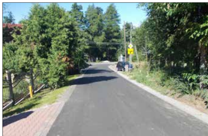
ul. Folwarczna w Kończycach Małych