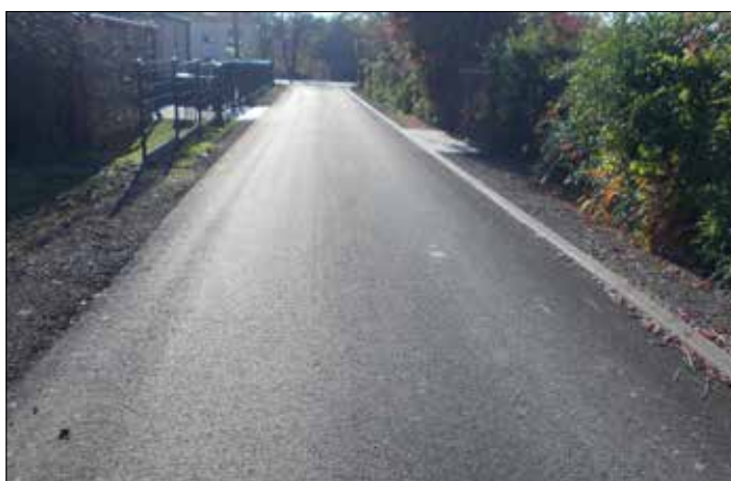
droga boczna od ul. Sobieskiego w Kaczycach