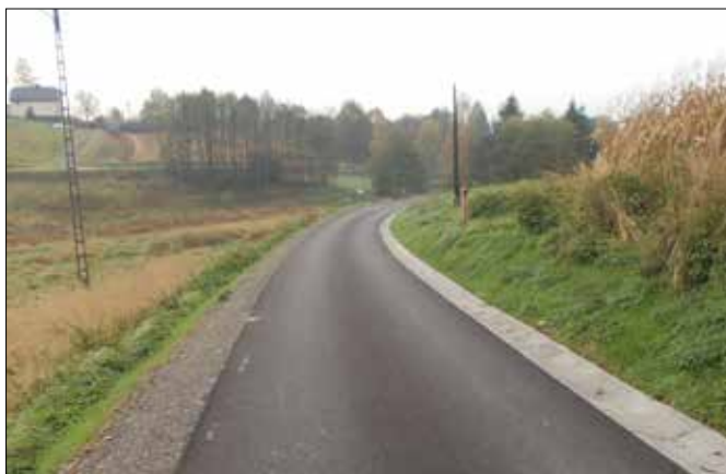
ul. Polna w Markłowicach Górnych - V etap