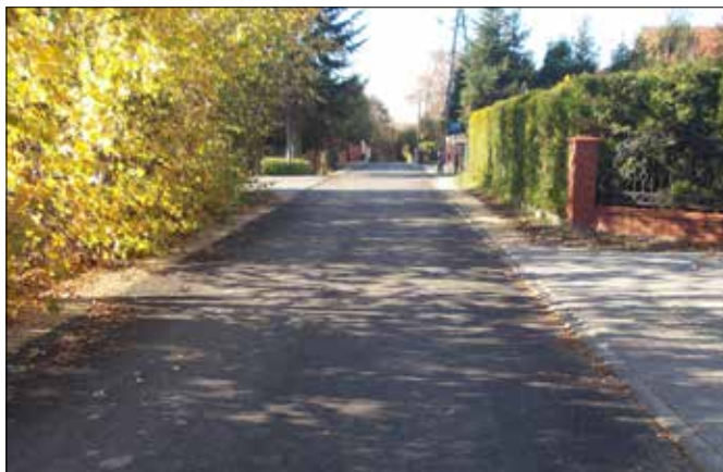
ul. Agrestowa w Zebrzydowicach