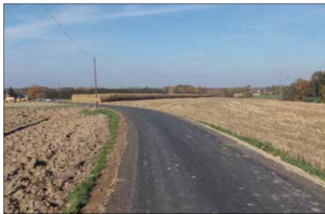
ul. Wiśniowa w Kończycach Małych