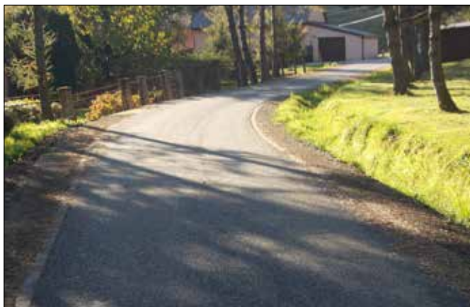
ul. Stawowa w Zebrzydowicach