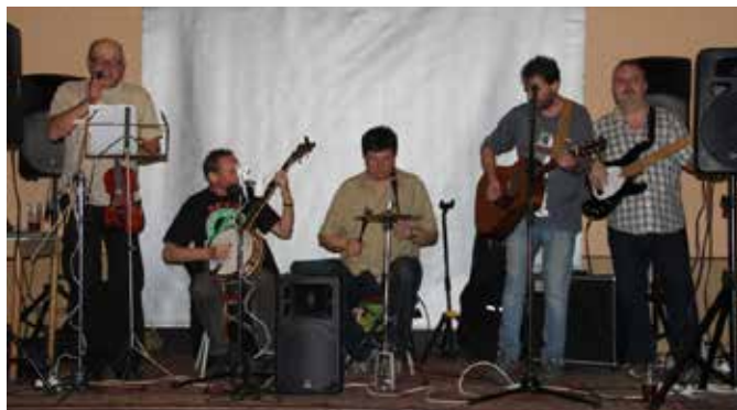
Kapela „Blaf” zagrała na „Zabijaczce” w Frysztacie.

Na imprezie Miejsowego Koła bawiło się ok. 120 osób. Organizatorzy zaprosili w tym roku aż trzy kapela. W głównej sali odbył się wieczorem koncert popularnego zespołu „Blaf” (rozpoczynający się od kultowego utworu „Cug do werku”), przy barze przygrywała „do kieliszka” kapela ludowa Adama Sikory, w namiocie ustawionym