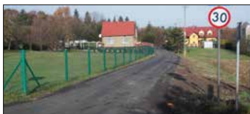
ul. Tuwima (boczna)

Wykonano również przebudowę drogi bocznej od ul. Tuwima w Kaczycach. Zakres robót obejmował wykonanie nowej konstrukcji podbudowy z nawierzchnią asfaltową na długości ok. 260 mb. Zadanie uzyskało dofinansowanie ze środków Zarządu Województwa Śląskiego.