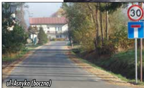
ul. Asnyka (boczna)