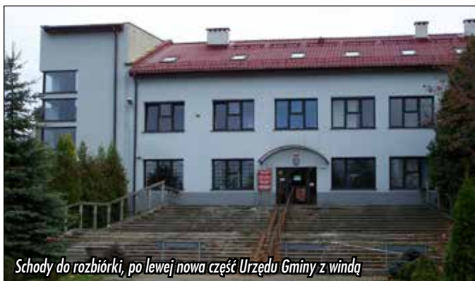
Schody do rozbiórki, po lewej nowa część Urzędu Gminy z windą

MODERNIZACJA URZĘDU GMINY - Na ukończeniu są prace związane z dobudową klatki schodowej i szybu windowego do budynku Urzędu Gminy. Wykonano instalację elektryczną, wod-kan, c.o. oraz alarmową, położono tynki wewnętrzne. Trwają prace adaptacyjne w pomieszczeniach przylegających do dobudowanej klatki schodowej. Na zewnątrz klatki schodowej wykonano wyprawę elewacyjną. Prace budowlane zostaną ukończone w pierwszej połowie grudnia br.