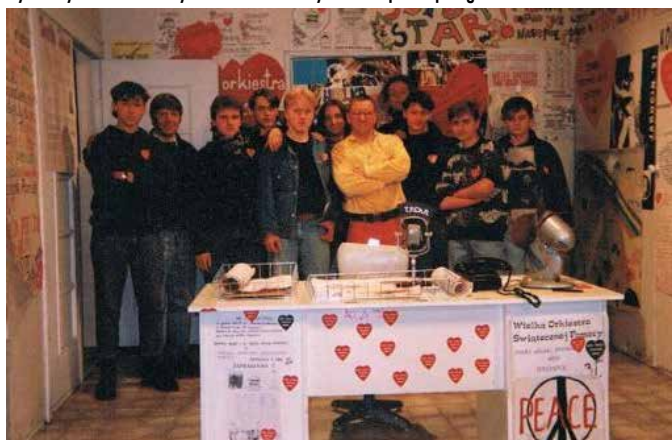
Fot: Grupa młodzieży z gminy Zebrzydowice w programie „Róbta co chceta” Jurka Owsiańska

Pamiętam pierwszy koncert WOŚP. Było to 3 stycznia 1993 r. Jakiś wariat promował ją w telewizji a przerwaniemi jego wypowiedzi były wstawki muzyki, która mimo mojego dość młodego wówczas wieku, bardzo mnie drażniła. Język i nonszalancja wypowiedzi młodziana w czerwonych okularach, jego „róbta co chceta” ogromnie mnie irytowały. Nie bardzo było wiadomo na czym ta akcja ma polegać?