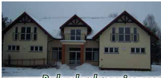
Budynek rekreacyjno-sportowy w Kończycach Małych

Regionalny Program Operacyjny Województwa Śląskiego - realna odpowiedź na realne potrzeby Informacje źródłowe na temat Regionalnego Programu Operacyjnego Województwa Śląskiego na lata 2007 – 2013 znajdują się na stronie www.rpo.slaskie.pl