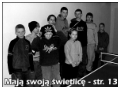
Mają swoją świetlicę - str. 13

Na sesji 30.XII.2004 r. Rada Gminy przyjęła budżet na 2005 r. Po stronie dochodów zamknięta się on kwotą 18.431.341 zł a wydatków 18.535.659 zł. Na inwestycje przyznacza się z budżetu kwotę 2.668.100, co stanowi 14,4%. Kwota ta to w większości środki na zabezpieczenie tzw. udziału własnego. Pozyskanie zaplanowanych środków zewnętrznych spowoduje, że wartość inwestycji zamknie się kwotą około 5 mln zł. (około 25% budżetu). Część środków inwestycyjnych będzie pochodzić ze źródeł zewnętrznych w tym funduszy strukturalnych UE (ZPORR, SPO-ROL). dok. na str. 11