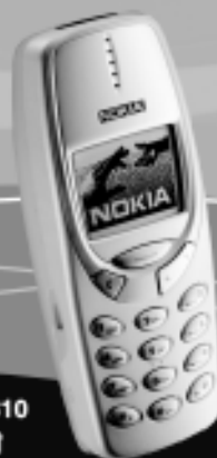
NOKIA 3310 za 1 zł * (1,22 zł brutto)

PROMOCJA. Szczegóły oferty w regulaminie Promocji.