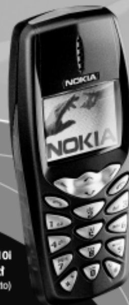
NOKIA 3510i od 19 zł (23,18 zł brutto)