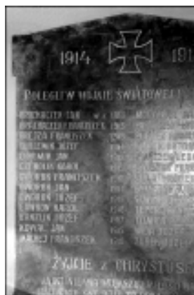
Zdjęcie tablicy w kościele w Kończycach Małych

Tablica pamiątkowa utworzenia parafii i upamiętniająca mieszkańców z Kończyc Małych poległych podczas I wojny światowej