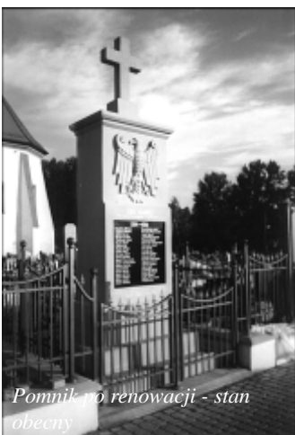
Pomnik w renowacji - stan obecny