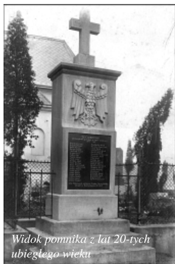
Widok pomnika z lat 20-tych ubiegłego wieku