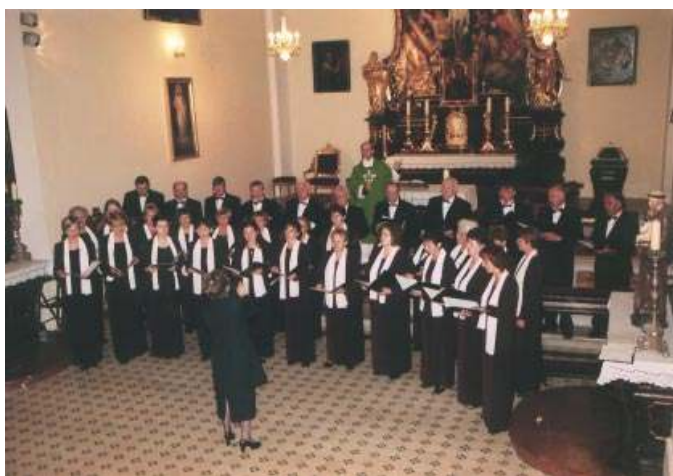
Koncert na Kahlenbergu w 2002 roku.

Potomność zapamiętała końcowy fragment bitwy wiedeńskiej stoczonej w niedzielę 12 września 1683 roku - szarżę polskiej husarii walącej prosto na zielony sztandar Proroka i czer-