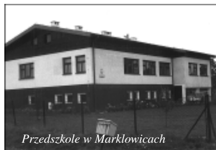
Przedszkole w Markłowicach