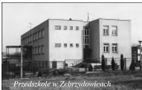
Przedszkole w Zebrzydowicach