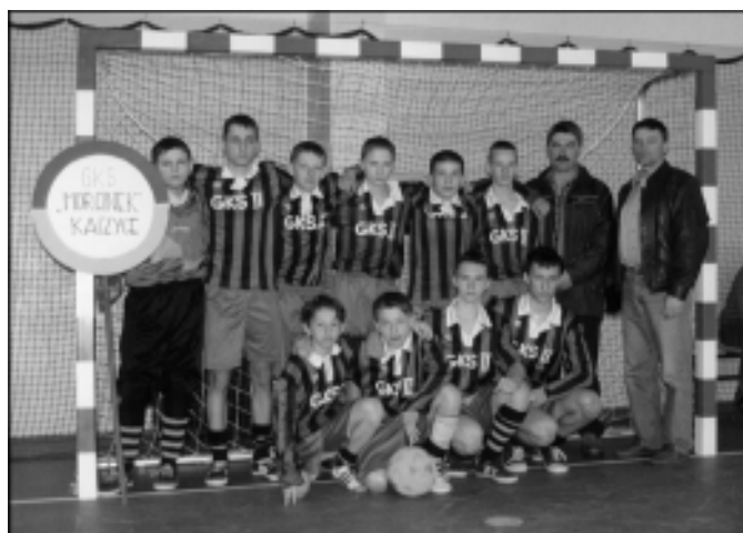
Trampkarze z Kaczyce

W dniu 29 marca w hali sportowej Zespołu Szkół w Zebrzydowicach odbyły się rozgrywki piłkarskie w których uczestniczyły drużyny trampkarzy i juniorów klubów piłkarskich z terenu naszej gminy.