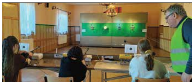
Szkoła Podstawowa w Kończycach Małych