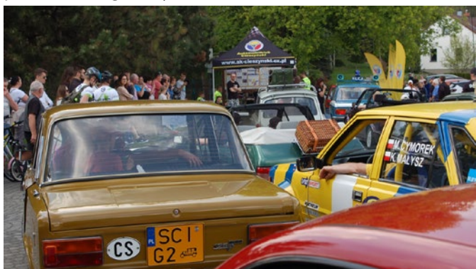
Red., Fot: Antoni Bury

Obszerny fotoreportaż z wydarzenia dzięki uprzejmości pana Antoniego Bury, na stronie www.zebrzydowice.net