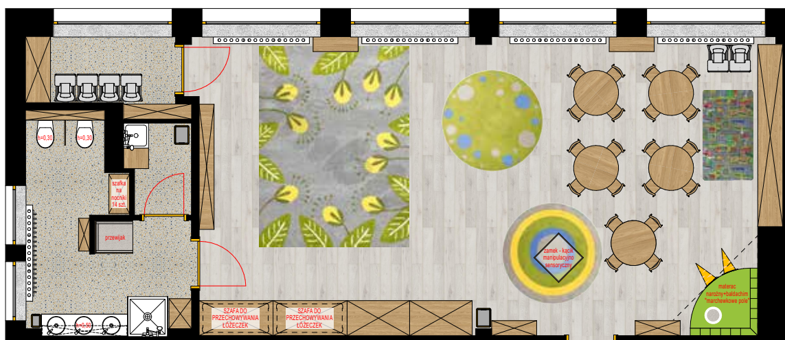
SALA NR 1 RZUT

Zachęcamy do zapisów, szczegółowych informacji udziela Gminne Przedszkole Publiczne w Zebrzydowicach oraz Urząd Gminy Zebrzydowice.