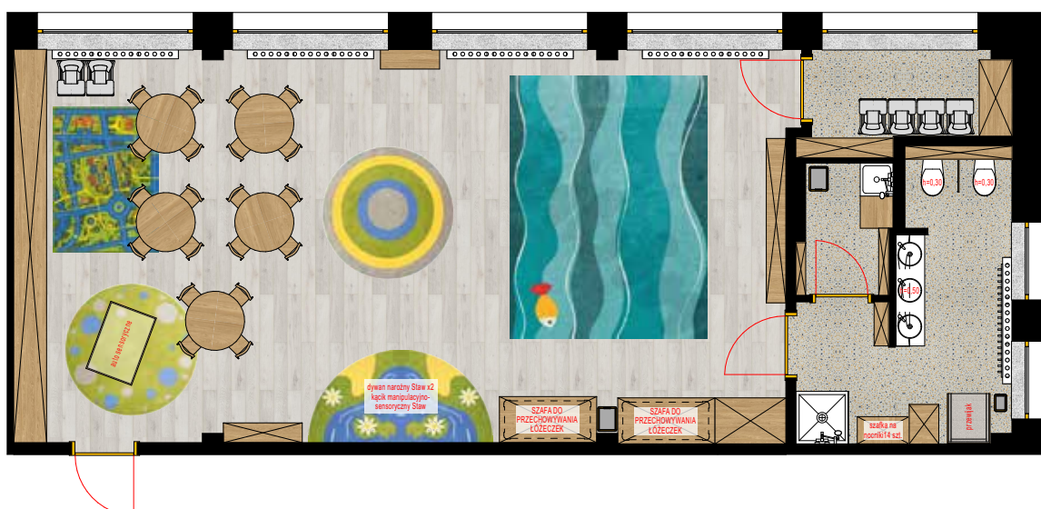
SALA NR 2 RZUT